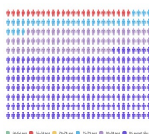
Profils par âge AJDG