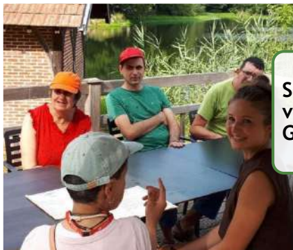
Séjours vacances Globtours