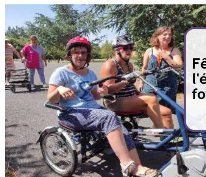
Fête de l'été au foyer