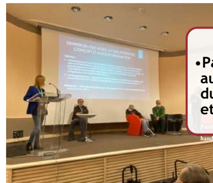
•Participation aux assises du handicap et du soin