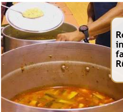
Repas invitation famille de la Rûche