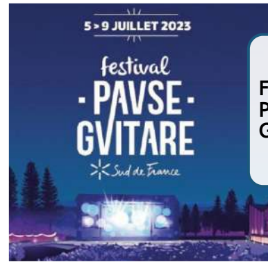
Festival Pause Guitare